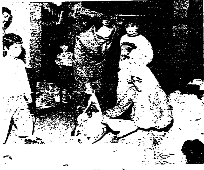
في بيروت الغربية